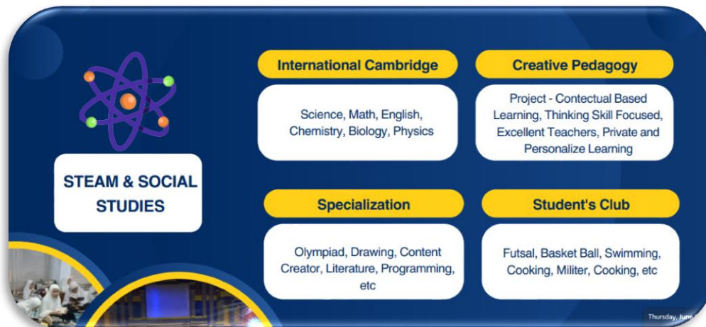
Gambar 3. Pendekatan STEAM dan Social Studies

Manajemen kurikulum di Al-Aqobah secara sistematis memadukan elemen-elemen STEAM ke dalam pelajaran madrasah, dengan merancang silabus yang tidak hanya fokus pada output akademik, tetapi juga membentuk cara berpikir saintifik dan kreatif. Dalam mata pelajaran matematika, misalnya, para guru tidak sekadar mengajarkan rumus, tapi menekankan bagaimana logika matematika membentuk etika berpikir sistematis dalam menyelesaikan masalah-masalah kehidupan umat. Di sinilah pendekatan STEAM difungsikan sebagai jembatan antara ilmu dan nilai.