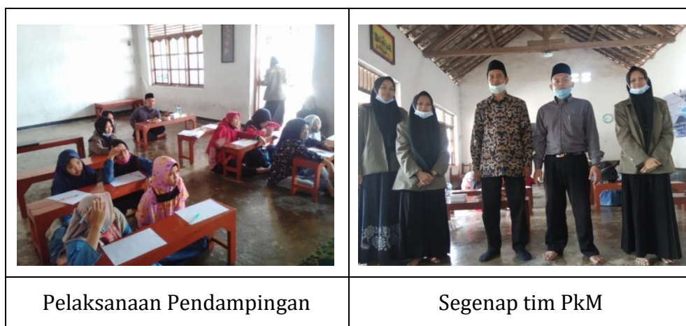
Gambar 2 : Pelaksanaan Program dan Tim

Dalam pengembangan aset, upaya yang dilakukan tim PkM yaitu dengan meminta izin terlebih dahulu untuk mengadakan program pelatihan privat bagi santri yang kurang tanggap dalam pembelajaran, pembuatan batik celup dan life skill dengan menggunakan sampah non organik, kemudian menjelaskan maksud dan rencana untuk ke depannya disertai dengan metode dan alasan yang mendukung.