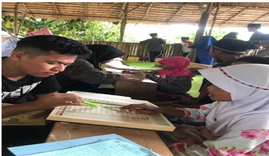
Gambar 3: kegiatan pendampingan mengaji

Pelaksanaan kegiatan PkM tematik STISIPOL Candradimuka yang diselenggarakan selama satu bulan dari tanggal 1 Agustus sampai dengan 31 Agustus 2022 disambut baik oleh warga masyarakat dusun empat Desa Suka Raja Baru, pendampingan keterampilan membaca Al-Qur'an, menulis kaligrafi dan kegiatan sosialisasi tentang pentingnya mengutamakan hak-hak anak. Anak-anak dan kedua orang tua serta masyarakat setempat menyambut baik atas kegiatan PkM tematik dari kampus STISIPOL Candradimuka.