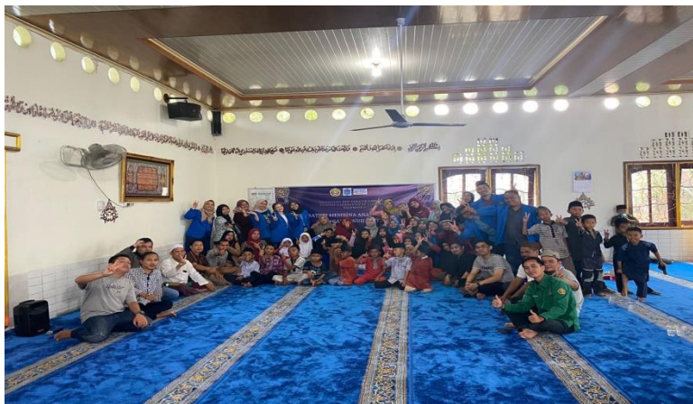
Gambar 6: Kegiatan sosialisasi pentingnya 4 hak-hak anak