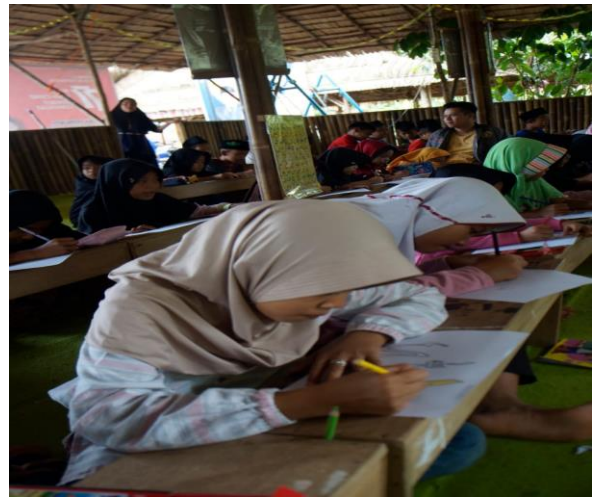
Gambar 5: Anak-anak sedang menulis kaligrafi