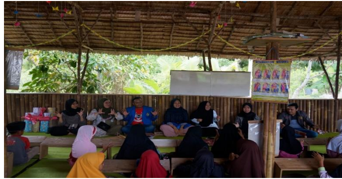
Gambar 4: Pendampingan dari mahasiswa sebelum mengikuti lomba 17 agustus