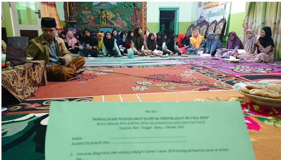
Gambar 2 Kegiatan Seminar

anggota IPNU & IPPNU, sehingga untuk mendukung suksesnya program ini pengurus IPNU & IPPNU membantu mahasiswa dalam mengkoordinasi anggotanya, tempat seminar dan juga alat-alat yang perlu di gunakan ketika kegiatan seminar, tidak hanya itu, mitra kami yaitu pengurus IPNU & IPPNU sangat terbuka dan bersedia untuk mengikuti kegiatan sosialisasi pemahaman dampak pernikahan di usia dini.