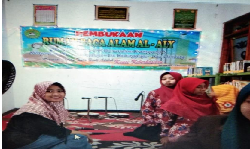
Gambar 1: Pengenalan Program

Realisasi dalam tahap yang ke dua ini, adalah melalui forum grup diskusi (FGD), pelaksana program mengundang sejumlah personil yang dinilai mampu untuk menggerakkan pihak-pihak terkait, dari situ juga akan dijaring berbagai usulan sebagai langkah awal berjalannya program.