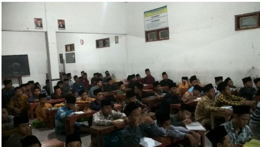
Gambar 2. Acara Seminar