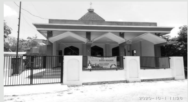
Gambar 1. Bangunan Masjid Mubarak Pulorejo

a mitra pengabdian mengadakan evaluasi tentang apa saja kekurangan dan kebutuhan untuk penyusunan ta'mir masjid.