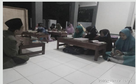
Gambar 5. Suasana belajar perdana TPQ di masjid Mubarak

Setelah Peneliti selesai mendampingi Takmir masjid dalam pembukaan TPQ, dilanjutkan evaluasi tentang apa saja kekurangan dan kebutuhan dalam taman belajar baca tulis Al-Qur'an. Ternyata dalam taman belajar baca tulis Al-Qur'an membutuhkan buku absen dan buku prestasi untuk mencatat hasil belajar anak. Peneliti juga membahas metode mengajar yang paling sesuai untuk anak-anak yang akan ditindak lanjuti oleh kepala TPQ di kemudian hari.