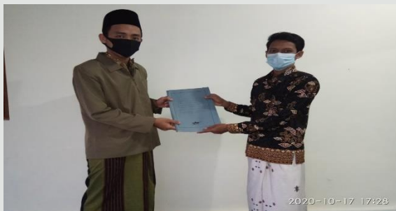
Gambar 5. Penyerahan SK Takmir Masjid Mubarak dari Pemerintah Desa Wates

Salah satu kekurangan saat pembentukan ta'mir masjid adalah SK dari pemerintah desa dengan menyetorkan foto copy KTP dari setiap anggota ta'mir. Selain itu, Takmir masjid juga memerlukan papan struktur ta'mir masjid dan jadwal imam/muadzin sholat