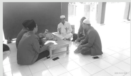
Gambar 3. Suasana musyawarah tim pembentukan Takmis Masjid Mubarak

Acara tersebut berjalan lancar dan telah berhasil membentuk susunan ta'mir masjid Mubarak yang resmi. Lebih dari itu Takmir masjid Mubarak yang baru terbentuk juga langsung berinisiatif untuk menyusun program kerja prioritas dalam jangka pendek. Di antaranya menyusun jadwal-jadwal imam/muadzin sholat 5 waktu, dan jadwal imam, khotib, dan bilal sholat jum'at. Jadwal ini sebelumnya sudah ada, namun masih bersifat tentatif.