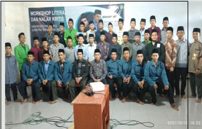
Peserta program kerja ( Work Shop Literasi dan Nalar Kritis)