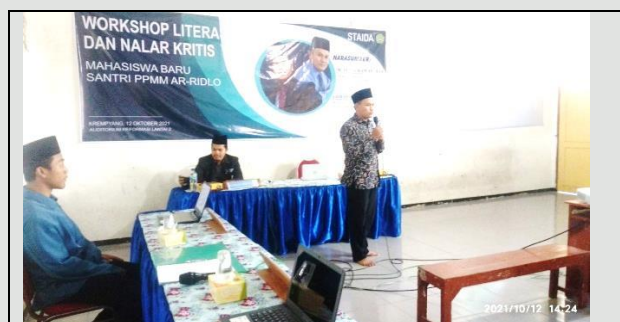
Implementasi program kerja ( Work Shop Literasi dan Nalar Kritis)